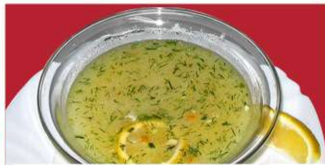
Рибена супа 1,4 Fish soup