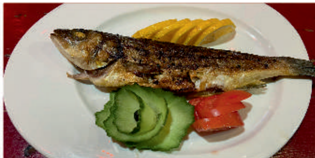
Лаврак на плоча 1,4 Pan-fried scad See bass cooked on griddle