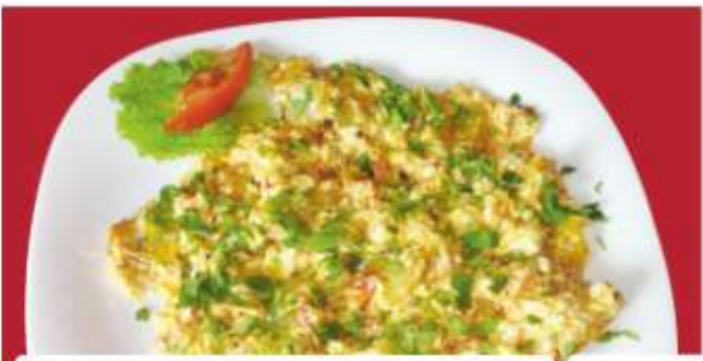
Миш-маш 3 Mish-Mash