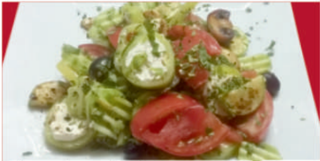
Салата Summer Paradise Summer Paradise Salad 3

/домат, краставица, гъби, тиквичка, чушка, сирене, маслини, магданоз, дреси /tomato, cucumber, mushrooms, zucchini, pepper, cheese, olives, parsley, dressing/