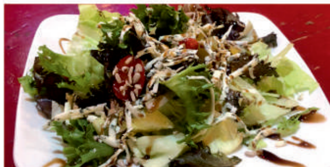
Салата "Мару" / Marie's salad 7,8

/мик свежи салати, чери домати, синьо сирене, ядки, дресинг/ /mix fresh salads, cherry tomatoes, blue cheese, nuts, dressing/