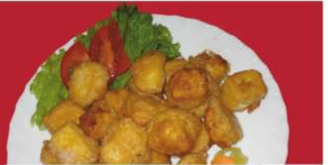
Сирени хапки 1,3,7 ..... gr White cheese bites ..... lv