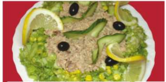
Зелена салата с риба тон 4 Green salad with tuna

/маруля, крававици, домати, риба тон, царевица, лимон/ /lettuce, cucumbers, tomatoes, tuna, corn, lemon/