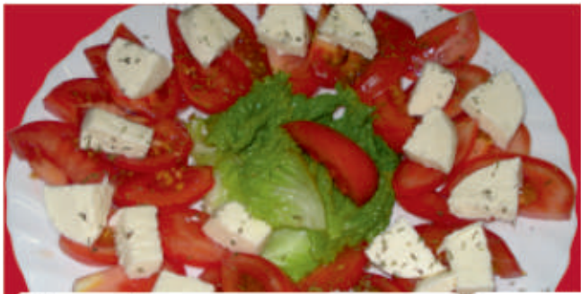
Капрезе / Caprese 7

/белени домати, моцарела, песто, каперси/ /peeled tomato, mozzarella, pesto, capers/