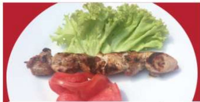
Пилешко шишче Chicken skewer