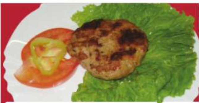
Кюфте Meat ball "Kufte"