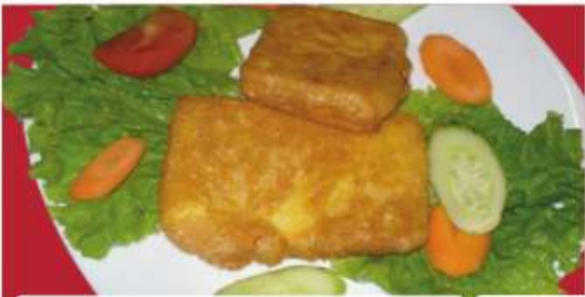
Кашкавал Пана 1,3,7 ..... gr Bulgarian fried cheese ..... lv