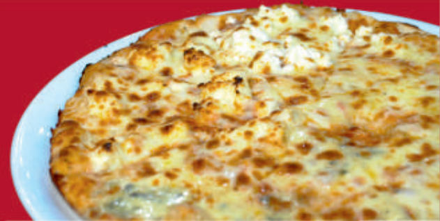
Четири сирена/ Quattro formaggi 1,7 /доматен сос, моцарела, рикота, горгонзола, пармезан, подправки/ /tomato sauce, mozzarella, ricotta, gorgonzola, parmesan, spices/