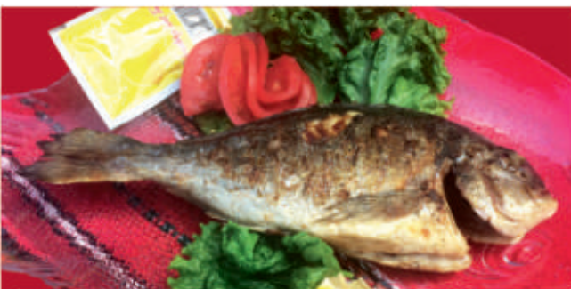
Ципура на скара 1,4 Pan-fried scad