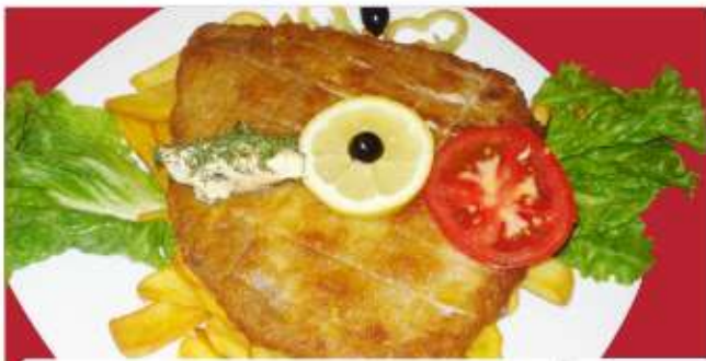
Шницел по виенски / Wiener Schnitzel

/контра филе, пържени картофи/ 1,3 /counter fillet, french fries/