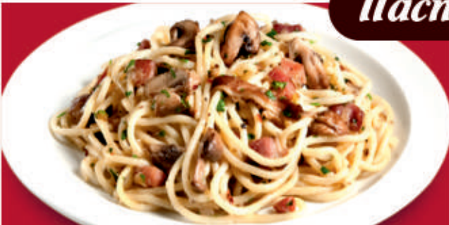
Спагети „Карбонара“/ Spaghetti Carbonara /спагети, приготвени с бекон, бяло вино, пармезан, сметана, яйце, подправки/ 1,3,7 /spaghetti, prepared with bacon, white wine, parmesan, cream, egg, spices/