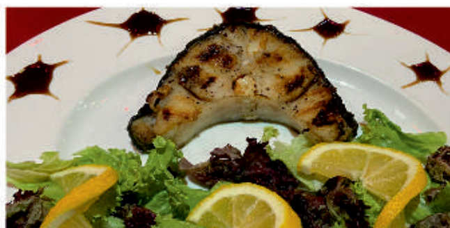
Акула котлет 4 Shark cutlet