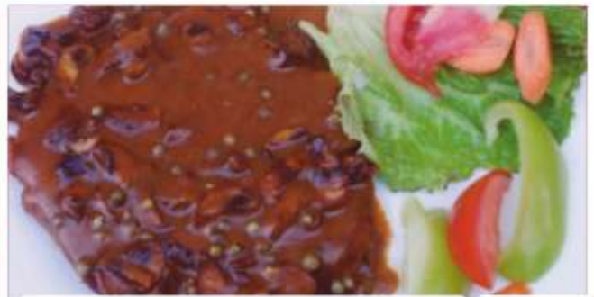
Свинско филе с гъби/ Pork fillet with mushrooms

/свинско контра филе, грейви сос, гъби, вино/ /pork counter fillet, gravy sauce, mushrooms, wine/