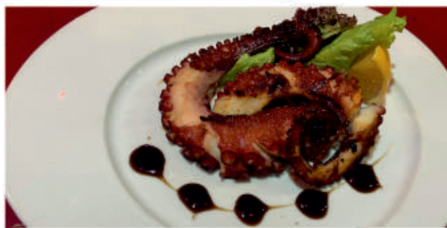
Октопод на тиган 2 Frying octopus