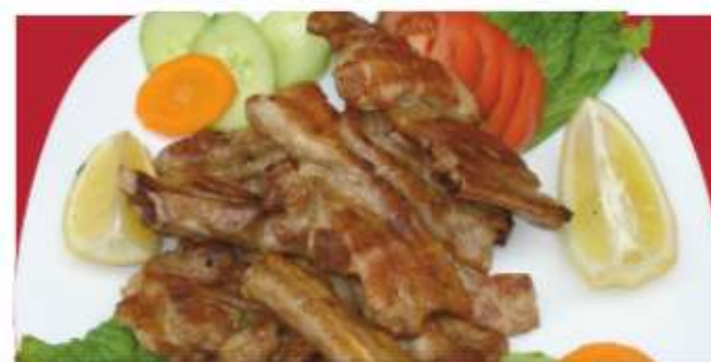
Свински ребра / Baked ribs

/свински ребра, мед, соев сос, кетчуп, барбекю сос/ /pork ribs, honey, soy sauce, ketchup, barbecue sauce/