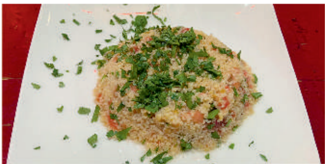
Табуле / Tabbouleh 1

/магданоз, белени домати, булгур, червен лук, канела, лимон/ /parsley, peeled tomatoes, bulgur, red onion, cinnamon, lemon/