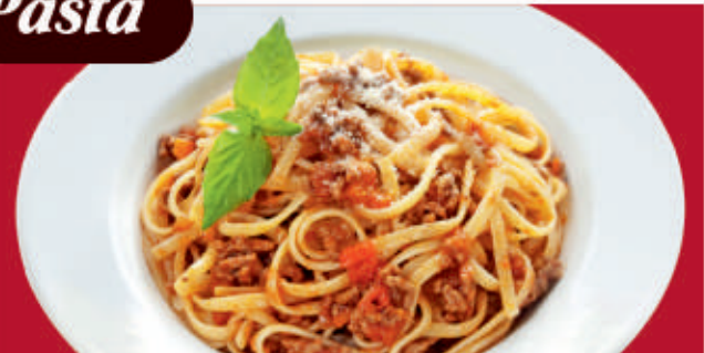
Спагети „Болонезе“/ Spaghetti Bolognese /спагети, приготвени с домати, кайма, целина, моркови, лук, вино, подправки/ 1,3,7 /spaghetti, prepared with tomatoes, minced meat, celery, carrots, onion, wine and spices/