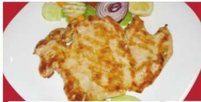
Пилешко филе (скара / тиган) Chicken fillet- grilled / fried