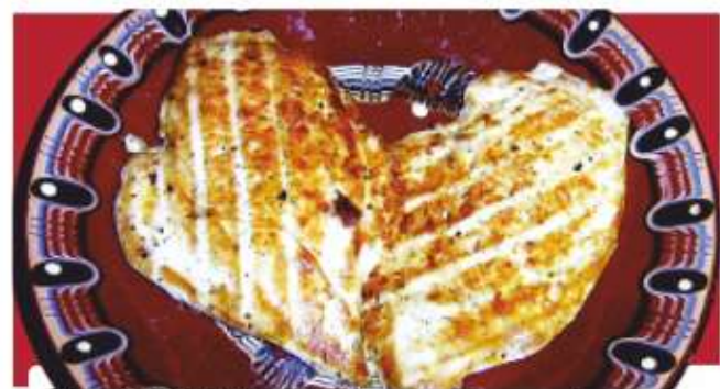
Свински карета на скара Pork fillets with courgettes, porcini mushrooms and pesto sauce