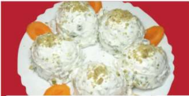
Млечна салата / Yogurt salad 7 /крававици, цедено кисело мляко, чесън, копър, орехи/ /cucumbers, strained yogurt, garlic, dill, walnuts/