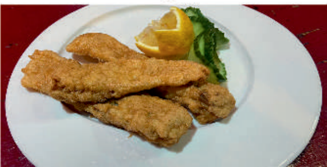
Ватос 1,3,4,7 Pan-fried vatos