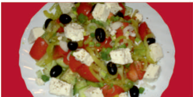
Гръцка салата / Greek salad 7

/домати, краставици, маруля, фета сирене, лук, маслини, риган, зехтин/ /tomatoes, cucumbers, lettuce, feta cheese, onion, olives, oregano, olive oil/