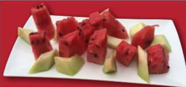
Плато плодове – голямо