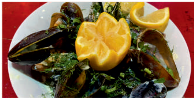
Миди с бяло вино и копър 2 Mussels with white wine and basil