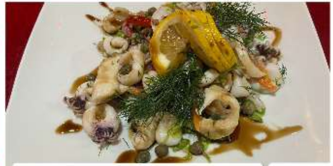
Морски дарове 2 Seafood salad