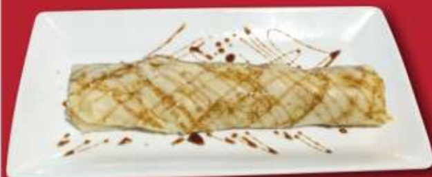
Палачинка с шоколад 1,3,7