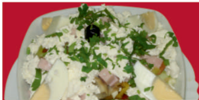
Овчарска салата / Shepherd's salad 3,7

/домати, краставици, печена чушка, мариновани гъби, сирене, шунка, лук, яйце, магданоз/ /tomatoes, cucumbers, grilled pepper, mushrooms, cheese, ham, onion, egg, parsley/