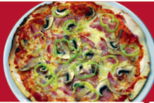
Капричоза/ Capricciosa 1,7 /доматен сос, моцарела, шунка, гъби, маслини, подправки/ /tomato sauce, mozzarella, ham, mushrooms, olives, spices/