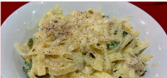
Талиатели с пиле и броколи 1,7 Tagliatelle with chicken and broccoli