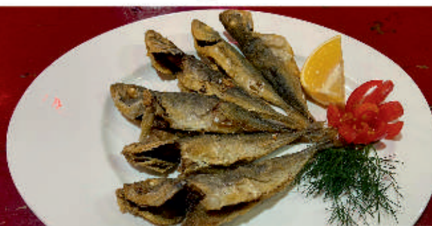
Сафрид 1,4 Pan-fried scad