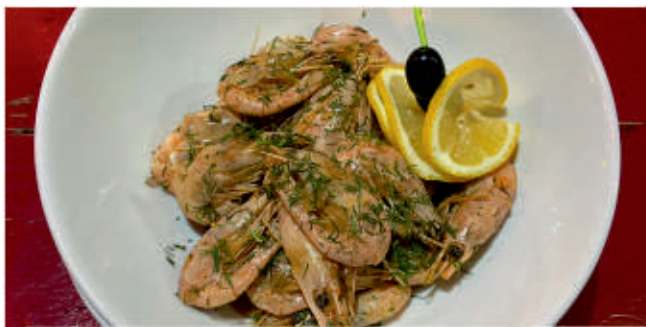
Скариди / Caridea

/Копър, чесън, пикантина, лимон/ 2 /Dill, garlic, piquancy, lemon/