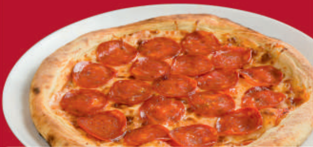
Пица „Салами“/ Pizza Salami 1,7 /Доматен сос, салам, кашкавал/ /tomato sauce, salami, cheese/