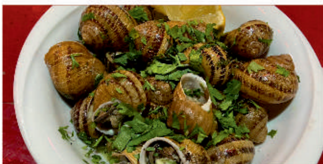
Охлюви по бургундски 2 Snails prepared in burgundy style