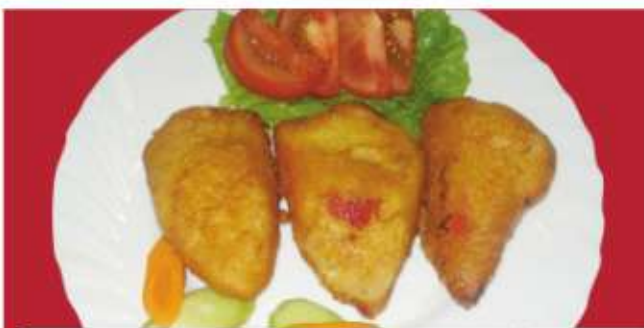
Чушка бюрек 1,3 ..... gr Breaded peppers stuffed with cheese ..... lv