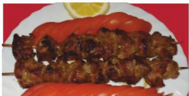
Свинско шيشче Pork skewer