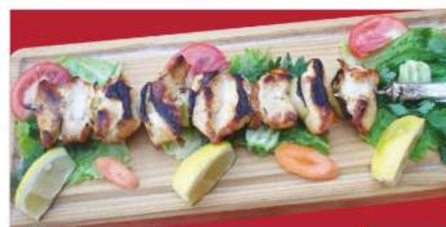
Свински шашлик Pork shashlik with vegetables

/свинско месо, гъби, лук, чушка/ /pork, mushrooms, onions, peppers/