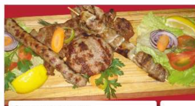
Свинска мешана скара Mixed pork grill