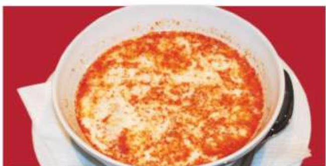
Шкембе 7 Shkembe