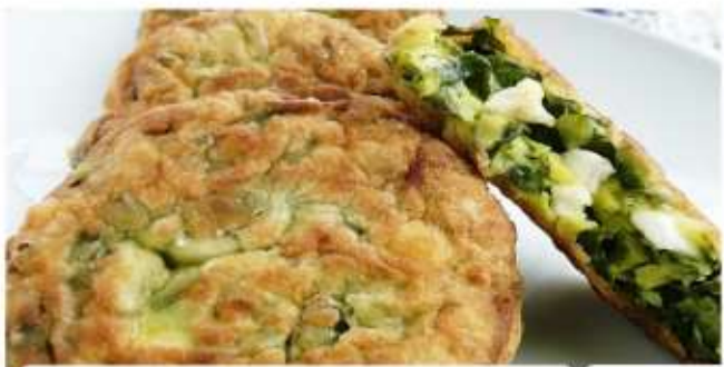
Спаначени кюфтета / Spinach meatballs