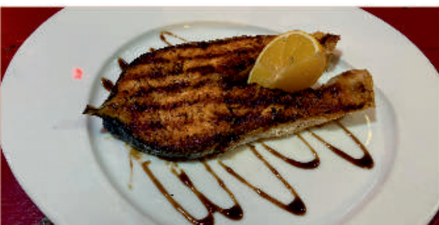
Филе от съомга 4 Pan-fried scad Salmon fillet