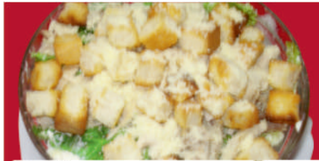
Цезар / Ceasar 7

/зелена салата, пилешко месо, домати, крутони, аншоа, пармезан, сос/ /green salad, chicken, tomatoes, croutons, anchovies, parmesan, sauce/