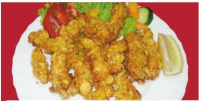
Пилешки хапки 1,7 Chicken bites with cornflakes