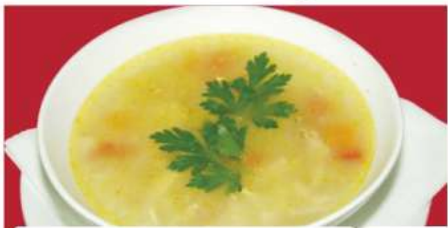
Пилешка супа 1,9 Chicken soup