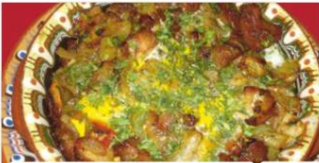
Свинска кавърма/ Pork kavarma

/свинско месо, червена и зелена чушка, домати, вино, лук/ /pork, red and green peppers, tomatoes, wine, onions/