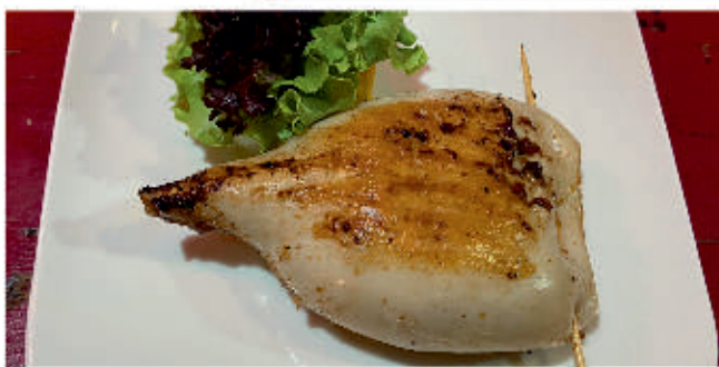
Пълнен калмар / Stuffed squid

/Сирене фета, орехи, сушени домати, лук, магданоз, риган, галета/ 2 /Feta cheese, walnuts, sun-dried tomatoes, onions, parsley, oregano, breadcrumbs/