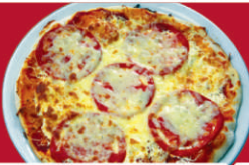
Маргарита/ Margarita 1,7 /доматен сос, кашкавал, подправки/ /tomato sauce, yellow cheese, spices/