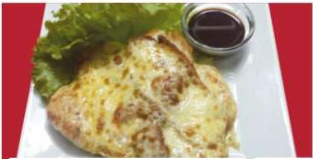
Пиле Ню Йорк/ Chicken New York 7

/пилешко филе, бекон, кашкавал/ /chicken fillet, bacon, yellow cheese/