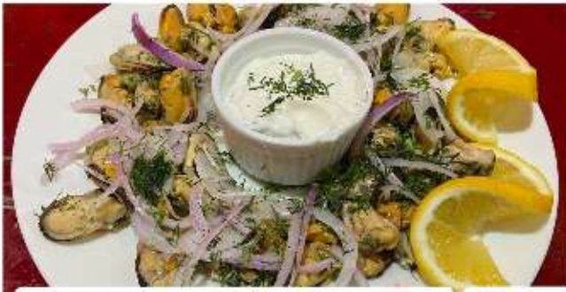
Салата с миди / Mussel salad 2 /Миди, лук, копър/ /Mussels, onions, dill/