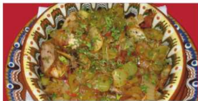
Кавърма / Kavarma

/пиле, лук, червена чушка, зелена чушка, пикантина, гъби, доматиен сос, бяло вино/ /chicken, onion, red pepper, green pepper, piquancy, mushrooms, tomato sauce, white wine/