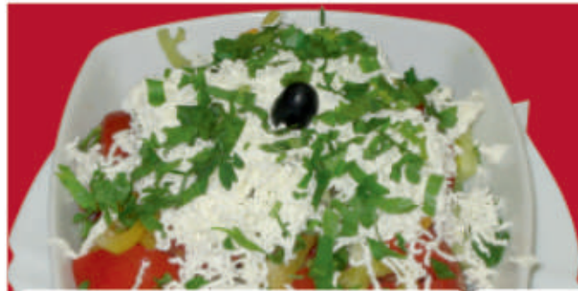
Шопска салата / Shopska salad 3,7

/домати, краставици, прясна чушка сирене, лук, магданоз/ /tomatoes, cucumbers, fresh pepper, cheese, onion, parsley/