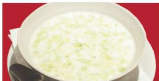
Таратор 7 Tarator