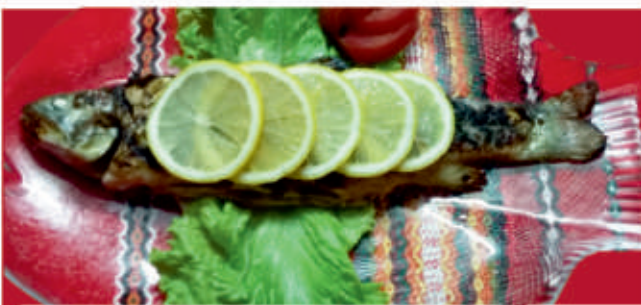
Пъстърва на плоча 4 Pan-fried scad Trout cooked on griddle