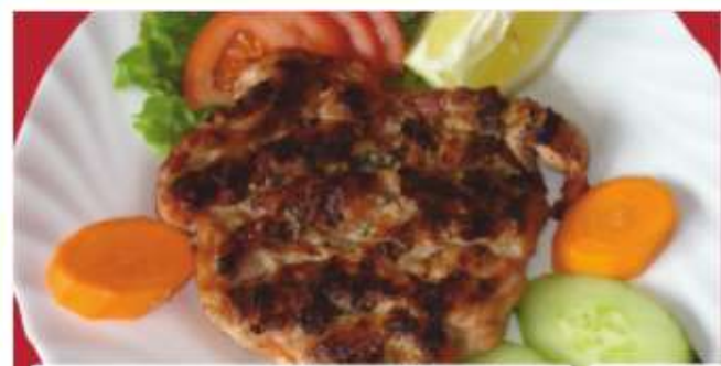
Вратна пържолa Pork neck steak