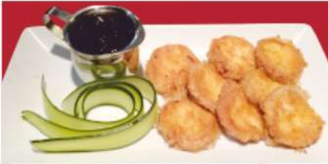
Панирани топени сиренца с боровинки ..... gr Fried melted cheese bites with blueberry jam 1,3,7 ..... lv