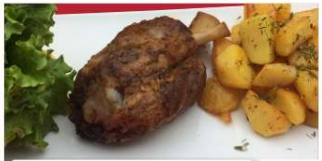
Свински Джолан / Pork knuckle

/печен джолан с картофи „Come“/ /baked shank with sauteed potatoes/