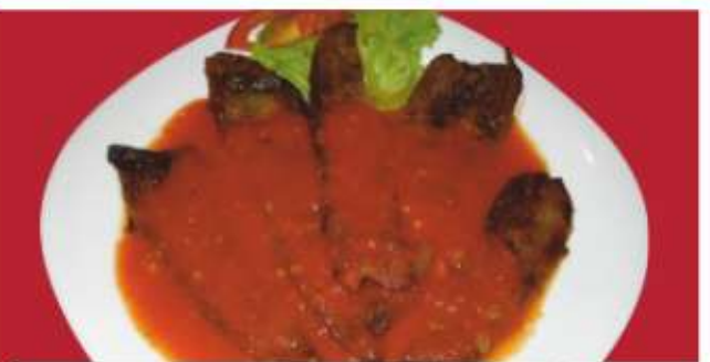
Чушки в доматен сос ..... gr Pepper in tomato sauce ..... lv